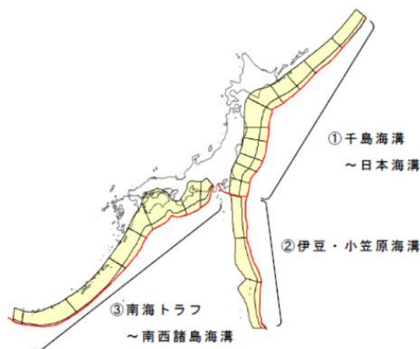
解説図 1 プレート間地震に起因する津波波源の対象領域